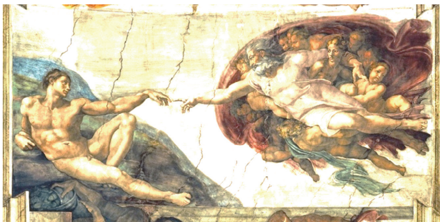
Фреска. Микеланджело, Сотворение Адама

Вспомним предыдущую эпоху, знаменитые картины, когда.... Вот слушайте – простите, может быть, вы знаете, поправите – знаменитая картина, где бог сидит... Отец Небесный на облаке и пальцем соприкасается с Сыном. Вспомните, есть такая знаменитая в Италии, по-моему, картина, очень красивая она. Я сейчас не помню, как называется. Это что такое? Это передача разряда от Отца Сыну по состоянию внутренней сути. То есть, фактически, вспоминаем мультик. Зевс что делал с горы? Молнии кидал. Молния – это что? Это разряд, но это ещё и заряд.